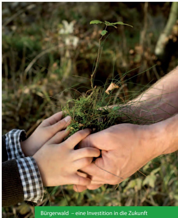
Bürgerwald – eine Investition in die Zukunft

Bereits ab einem Anteilsbetrag von 500,- € wird man zum Waldgenossen oder zur Waldgenossin und somit Mitglied einer aktiven Gemeinschaft in der Rechtsform einer eingetragenen Genossenschaft. Wer in den Wald investiert, ist also nicht allein. „Unser Wald“ bedeutet auch, ihn gemeinsam zu entwickeln. Dass wir ihn als Naturerlebnisraum vor unserer Haustür auch jenen Menschen näherbringen wollen, die in der Stadt leben, in einem meist waldfernen, urbanen Umfeld. Dass wir ihn nach definierten ökologisch ausgerichteten Standards bewirtschaften, so dass er sich optimal entwickeln kann. Durch eine natürliche Verjüngung möglichst vieler Baumarten. Durch viel Alt- und Totholz. Durch die Ausweisung von Wildniszonen. So entsteht ein Bürgerwald, der von seinen Bürgern wertgeschätzt und aktiv erlebbar ist. Schutz und Entwicklung durch Holznutzung und ökologischen Waldbau. Gleichzeitig klimafreundlich und somit aktiver Klimaschutz.